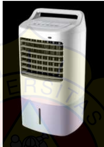
Gambar 2.3 Air Cooler

rendah dan kemudahan penggunaannya, air cooler menjadi pilihan yang populer untuk menciptakan kenyamanan di rumah atau kantor. Meskipun tidak seefektif AC dalam menurunkan suhu udara secara drastis, air cooler memberikan alternatif yang hemat energi dan efektif, dengan tambahan manfaat meningkatkan kelembapan udara di ruangan.