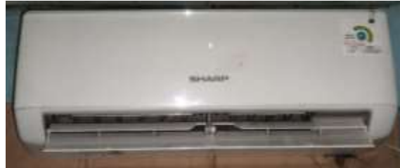
Gambar 2.2 Air Conditioner

mengatur kelembaban dan menyaring udara, sehingga menciptakan lingkungan yang lebih nyaman dan sehat.