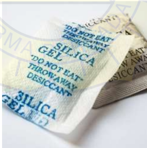
Gambar 2.4 Silica Gel

Silica gel dikenal sebagai bahan penyerap kelembaban yang berbentuk butiran padat dan menyerupai kaca, dengan struktur yang sangat berpori. Meskipun namanya mengandung kata "gel", material ini sebenarnya berbentuk padat. Silica gel dibuat secara sintesis dari natrium silikat ( \text{Na}_2\text{SiO}_3 ) melalui proses pembentukan sol, yaitu cairan seperti agar-agar yang kemudian mengalami pengeringan hingga menjadi butiran keras yang tidak elastis. Oleh karena kemampuannya menyerap uap air, silica gel sering dimanfaatkan sebagai penyerap kelembaban, bahan pengering, serta media penopang katalis. Selain itu, senyawa logam seperti garam kobalt juga dapat diserap oleh material ini [16].