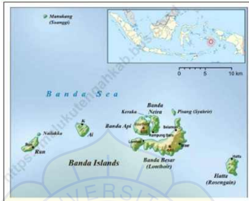
Gambar 1. 1 Peta Kepulauan Banda