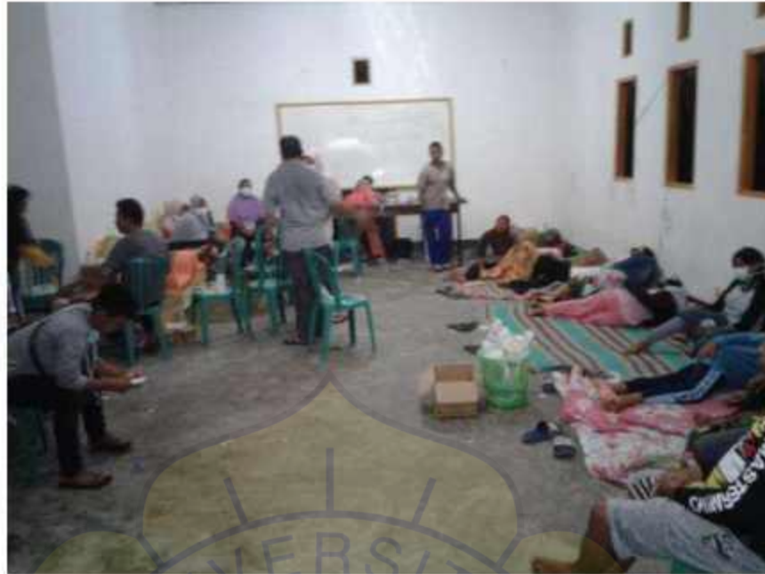
Gambar 1. 2 Kondisi RSUD Banda

Rumah sakit dapat dikategorikan menjadi 5 tipe yaitu tipe A, B, C, D, dan E. Berbagai rumah sakit memiliki sumber daya yang lebih sedikit dan jumlah dokter dan perawat yang lebih sedikit daripada yang lain; ini dikenal sebagai rumah sakit tipe D. Hanya ada satu rumah sakit di kepulauan Banda, yaitu RSUD Banda. Namun, RSUD Banda tidak memenuhi kriteria rumah sakit tipe D dalam hal infrastruktur atau staf medisnya. Rumah sakit tipe D di Indonesia diwajibkan oleh Peraturan No. 56 tahun 2014, yang dikeluarkan oleh Menteri Kesehatan, untuk memiliki staf setiap spesialisasi dasar dengan minimal empat dokter umum, seorang dokter gigi, serta seorang dokter spesialis. Namun, hanya ada satu dokter pegawai tidak tetap (PTT) dan satu dokter umum di RSUD Banda (BPS, 2023).