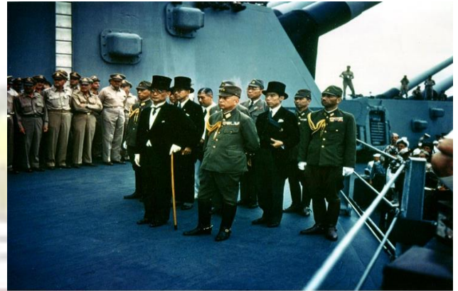
Photo # USA C-2719 Japanese delegation on USS Missouri, 2 Sept. '45