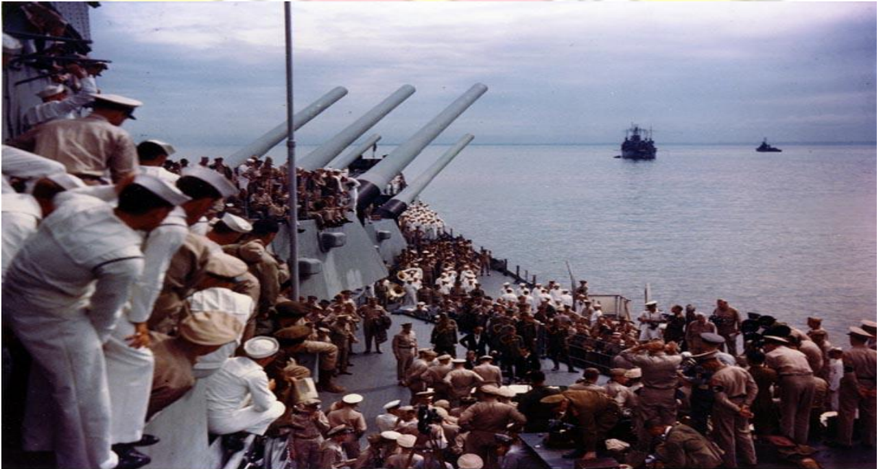
Photo # USA C-4626 Scene on USS Missouri at end of surrender ceremony