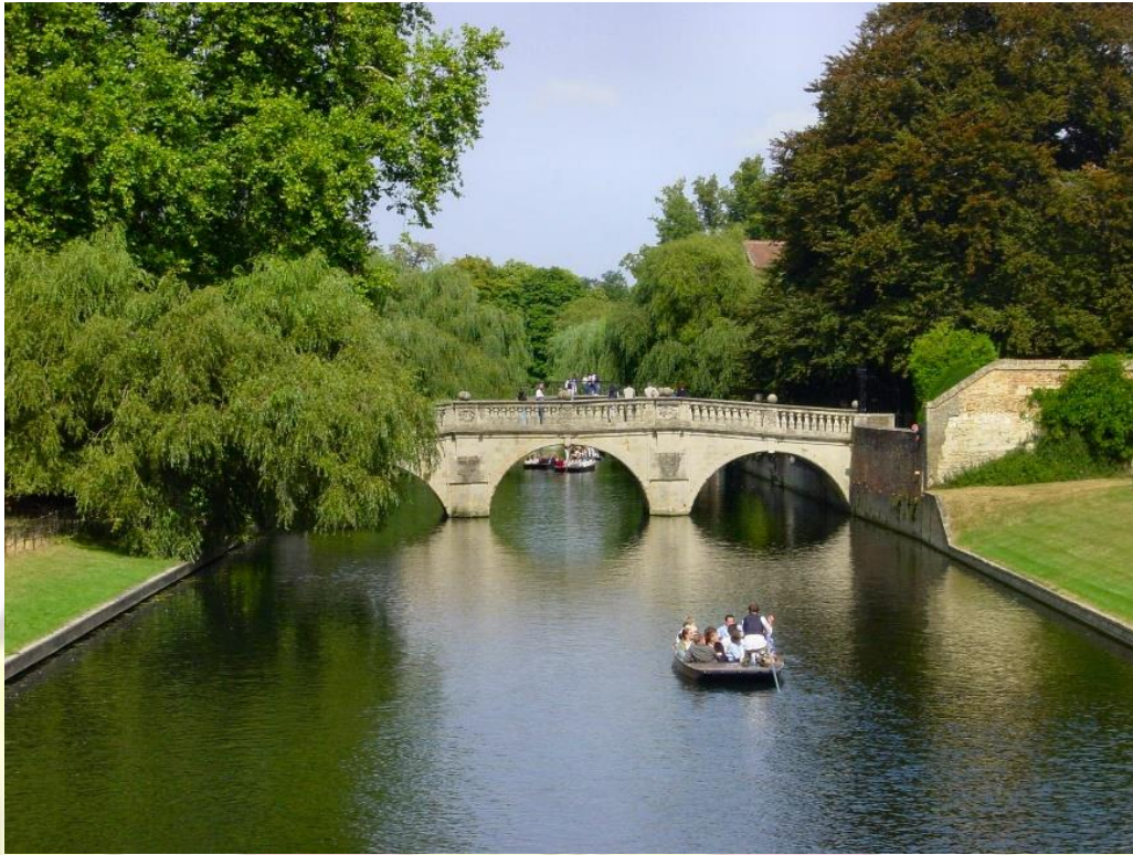
Keadaan Sungai Cambridge