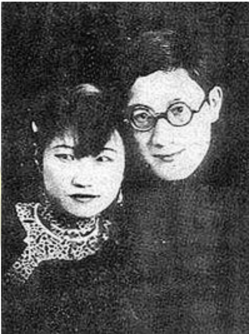
Xu Zhimo dan Lu Xiaoman