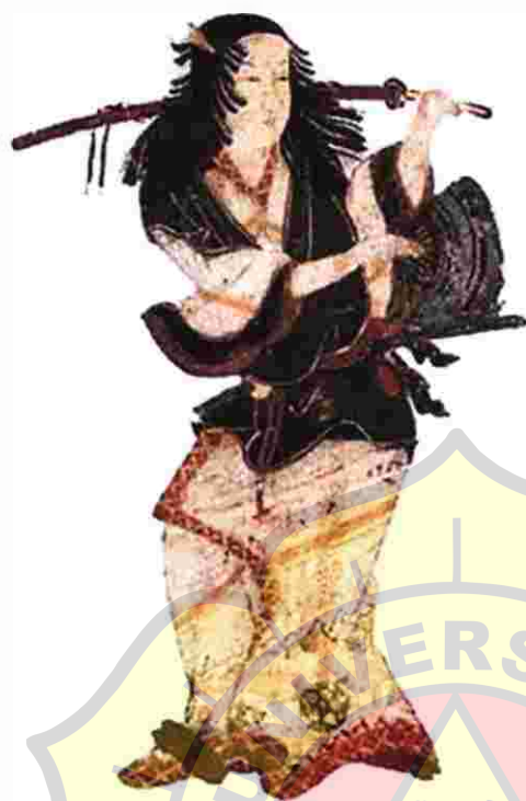
Gambar 1. Izumo No Okuni

Tarian pertama Izumo No Okuni adalah Nenbutsu Odori , kemudian disebut Kabuki Odori .