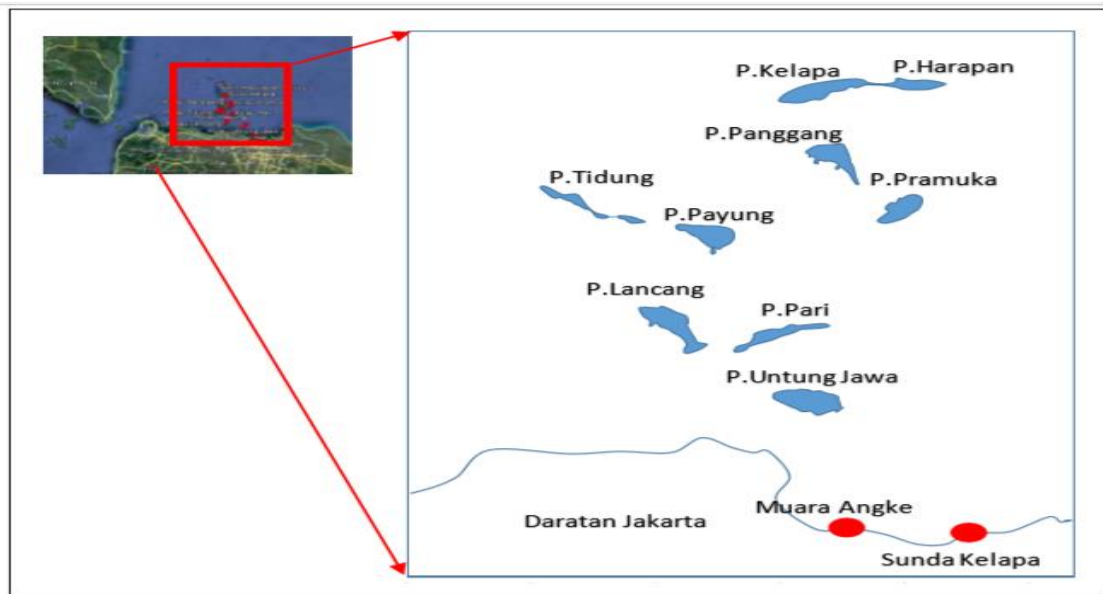
Gambar 1. Peta Kepulauan Seribu

Sarana dan sistem transportasi diperlukan untuk mendukung pengembangan destinasi pariwisata sebagai penunjang kebutuhan wisatawan domestik maupun mancanegara yang akan berkunjung ke Kepulauan Seribu. Pengembangan potensi wisata alam yang dipadu dengan wisata kesehatan harus dijaga kemurniannya dalam pengembangannya dan harus memperhatikan berbagai dampak terhadap lingkungan maupun masyarakat sekitar. Penggunaan teknologi yang ramah lingkungan menjadi salah satu gagasan yang perlu dipertimbangkan dalam pencapaian pengembangan ini (Purwanto & IKAP, 2015). Energi terbarukan mempunyai potensi lebih unggul dibandingkan energi fosil. Ada beberapa alasan yang mendasari, antara lain karena persediaannya yang tak terbatas, dapat diperbaharui dan ramah lingkungan. Energi matahari, air, angin, biomassa, laut dan sumber energi alternatif lainnya tersedia secara melimpah di alam, sedangkan pemanfaatannya masih sedikit. Mengingat ketersediaan cahaya matahari sepanjang tahun, maka sangatlah tepat jika energi matahari ini dimanfaatkan sebagai penyedia energi listrik (Purwanto & IKAP, 2015).