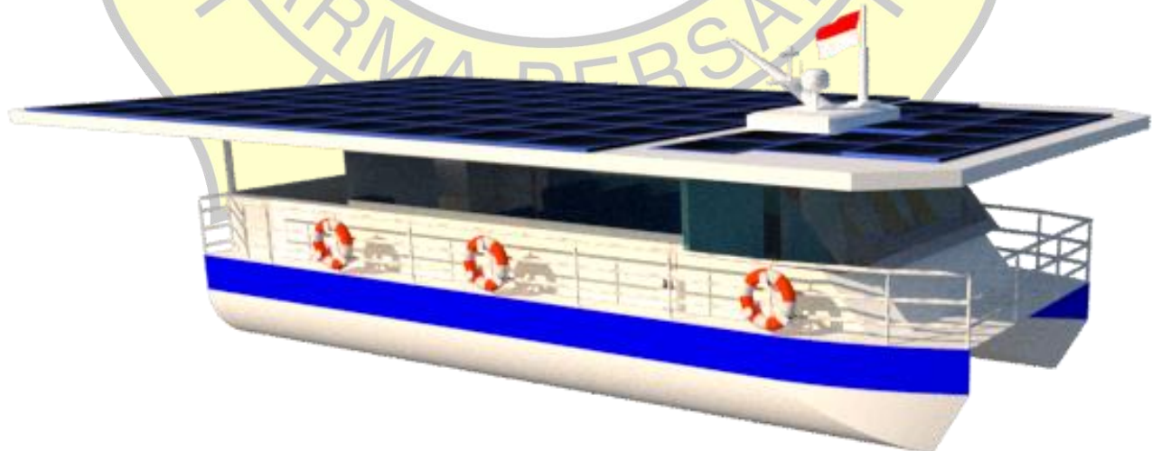
Gambar 3. Desain Kapal