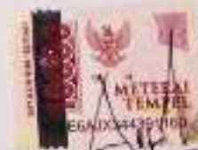
Ainum Nur Sa'adah