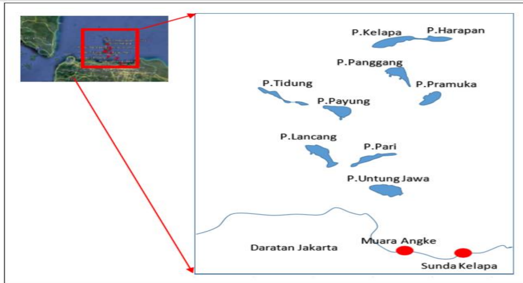
Gambar 1. Peta Kepulauan Seribu

Sarana dan sistem transportasi diperlukan untuk mendukung pengembangan destinasi pariwisata sebagai penunjang kebutuhan wisatawan domestik maupun mancanegara yang akan berkunjung ke Kepulauan Seribu. Pengembangan potensi wisata alam yang dipadu dengan wisata kesehatan harus dijaga kemurniannya dalam pengembangannya dan harus memperhatikan berbagai dampak terhadap lingkungan maupun masyarakat sekitar. Penggunaan teknologi yang ramah lingkungan menjadi salah satu gagasan yang perlu dipertimbangkan dalam pencapaian pengembangan ini (Purwanto & IKAP, 2015). Energi terbarukan mempunyai potensi lebih unggul dibandingkan energi fosil. Ada beberapa alasan yang mendasari, antara lain karena persediaannya yang tak terbatas, dapat diperbaharui dan ramah lingkungan. Energi matahari, air, angin, biomassa, laut dan sumber energi alternatif lainnya tersedia secara melimpah di alam, sedangkan pemanfaatannya masih sedikit. Mengingat ketersediaan cahaya matahari sepanjang tahun, maka sangatlah tepat jika energi matahari ini dimanfaatkan sebagai penyedia energi listrik (Purwanto & IKAP, 2015).