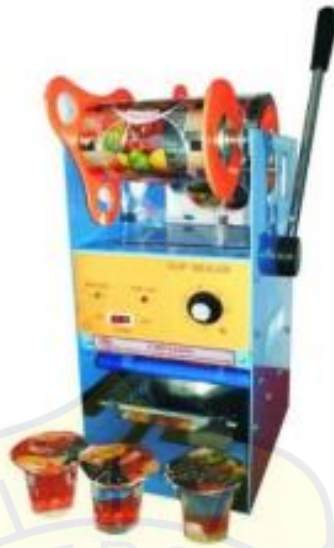
Gambar 2.1 Mesin Cup Sealer

Mesin cup sealer otomatis merupakan suatu mesin yang digunakan untuk mengemas produk cair atau semi cair ke dalam wadah berbentuk gelas plastik (cup) dengan cara menyegel bagian atas kemasan menggunakan plastik penutup melalui proses pemanasan. Mesin ini banyak digunakan dalam industri minuman, seperti air mineral, teh, susu, jus, dan berbagai jenis minuman lainnya. (Rahman & Setiawan, 2021)