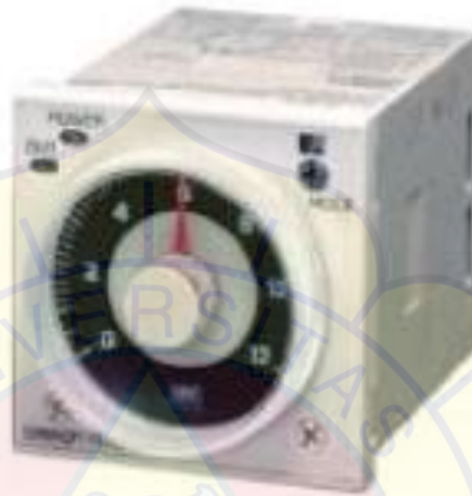
Gambar 2.2 H3CR

Time Delay Relay (TDR) merupakan salah satu komponen yang banyak digunakan dalam sistem kontrol listrik. TDR atau yang lebih dikenal dengan istilah timer berfungsi sebagai pengatur waktu tunda (delay) dalam suatu rangkaian listrik, baik untuk menghidupkan (ON) maupun mematikan (OFF) suatu sistem secara otomatis. (Omron, 2022)