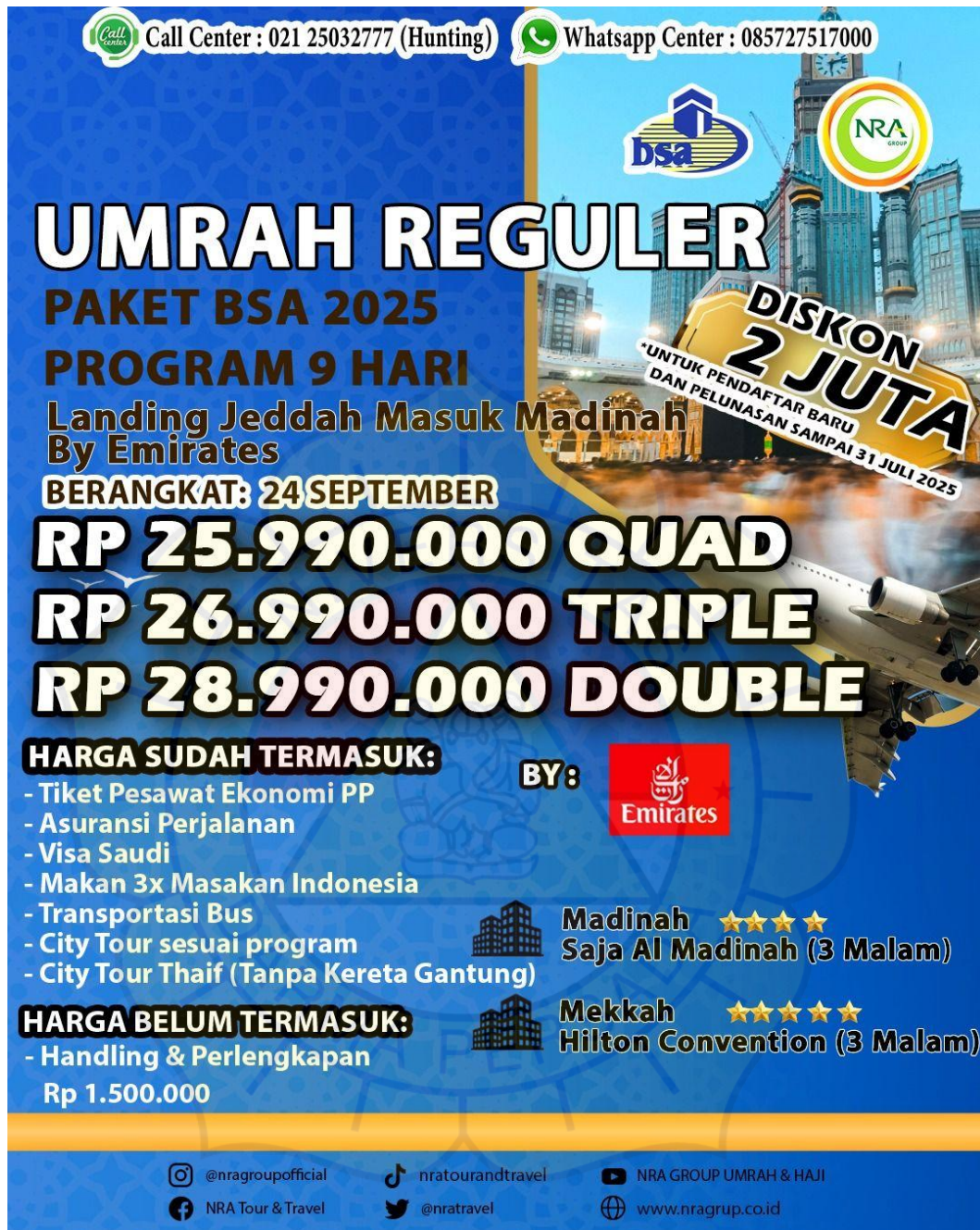
Lampiran A. 3 Brosur Paket Regular