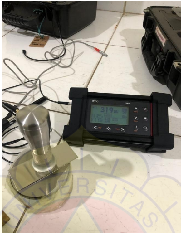
Gambar Lampiran 3 Pengujian Hardness Test Pada Plat SS304