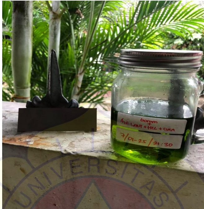
Gambar Lampiran 1 Cairan Asam dan Plat SS304