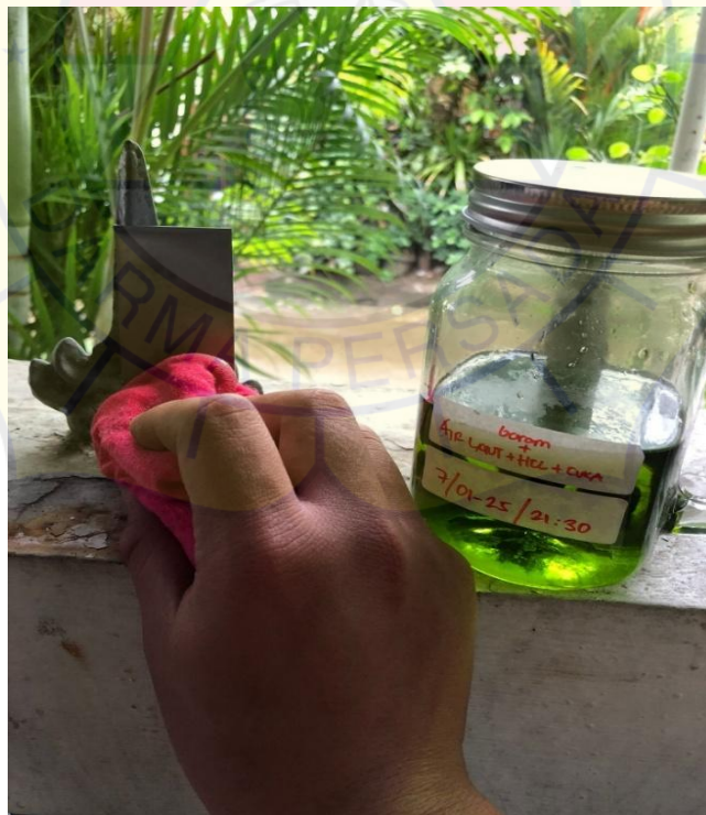
Gambar Lampiran 2 Pengolesan Cairan Asam Pada Plat SS304