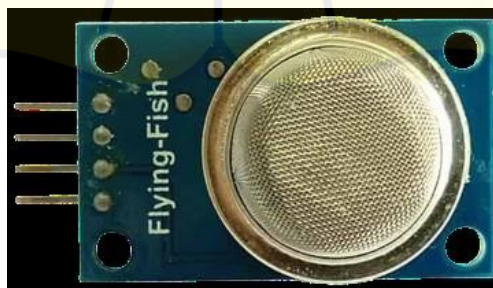
Gambar 2.2 Sensor Gas (MQ-2)

Jenis sensor ini adalah perangkat yang berfungsi untuk mengukur konsentrasi gas yang mudah terbakar di udara serta asap, menghasilkan output dalam bentuk tegangan analog. Sensitivitas sensor gas asap MQ-2 dapat diatur langsung dengan memutar trimpot yang ada. Sensor ini biasanya dipakai untuk mendeteksi kebocoran gas, baik di rumah maupun di industri. Beberapa jenis gas yang dapat dikenali meliputi LPG, i-butane, propane, methane, alkohol, hydrogen, dan asap. Sensor ini sangat ideal digunakan dalam alat darurat untuk mendeteksi gas, termasuk untuk mendeteksi kebocoran gas, mendeteksi asap guna mencegah kebakaran (Muhammad Ainun Najib et al., 2023)