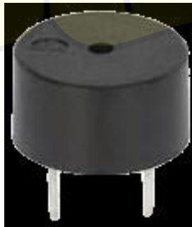
Gambar 2.6 Buzzer

Sebuah alat elektronik yang berfungsi untuk mengubah osilasi listrik menjadi suara disebut buzzer. Cara kerja buzzer mirip dengan pengeras suara, karena terdapat kumparan yang terhubung pada diafragma yang mendapatkan energi dan berfungsi sebagai elektromagnet (Jamaaluddin, 2021). Buzzer digunakan pada penelitian ini karena mampu menghasilkan suara yang nyaring dan jelas, sehingga sangat cocok untuk memberikan tanda atau peringatan ketika terjadi indikasi kebakaran. Buzzer juga efisien karena mengkonsumsi sedikit daya, menjadikannya pilihan ideal. Dengan mudah, buzzer dapat dihubungkan dengan mikrokontroler ESP32 dan diaktifkan menggunakan sinyal digital yang sederhana. Alat ini memiliki dua terminal yaitu positif dan negatif, sehingga penggabungan dengan rangkaian elektronik lainnya sangat mudah dilakukan. Salah satu kelebihan buzzer adalah kemudahan dalam penggunaannya serta respons cepat dalam mengeluarkan suara ketika menerima sinyal listrik. Selain itu, buzzer memiliki harga yang terjangkau dan ukuran yang kecil, membuatnya sempurna untuk berbagai proyek terutama pada penelitian ini (Rahman et al., 2024).