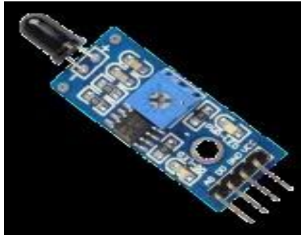
Gambar 2.4 Sensor Api (Sensor IR Flame )