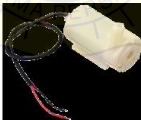
Gambar 2.9 Pompa Air

Pompa air dengan voltase 12V. Tipe pompa ini berfungsi untuk memindahkan cairan atau fluida dengan tekanan yang kuat, seperti air, minyak, atau zat kimia. Dalam studi ini, Pompa Air DC digunakan untuk mengalirkan air dari wadah ke luar melalui selang (Saputra et al., 2024).