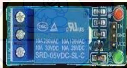
Gambar 2.7 Relay

Modul relay merupakan alat pengendali listrik yang berfungsi berdasarkan prinsip elektromagnetik. Alat ini mengubah keadaan saklar dari on ke off, atau sebaliknya (Saputra et al., 2024). Relay merupakan suatu tipe sakelar yang dioperasikan dengan listrik dan termasuk dalam kategori komponen elektromekanis. Komponen ini terdiri dari dua bagian utama yaitu elektromagnet dan bagian mekanis. Dengan memanfaatkan prinsip elektromagnetik, relay dapat memicu pergerakan kontak sakelar, sehingga arus listrik kecil dapat mengontrol arus listrik yang lebih besar (Zulkifli et al., 2024). Dalam penelitian ini, modul relay dimanfaatkan untuk mengatur arus listrik yang masuk ke dalam kipas fan dan pompa air.