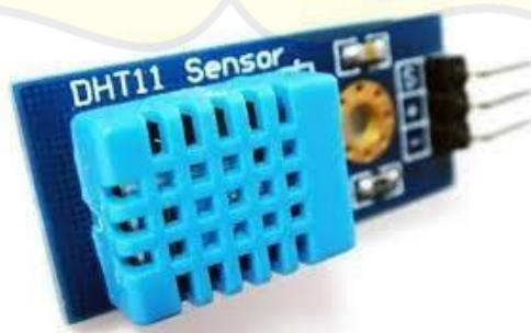
Gambar 2.5 Sensor Suhu (DHT-11)

Sensor DHT11 adalah modul yang berfungsi sebagai pengukur suhu dan kelembaban dengan memberikan sinyal keluaran berupa tegangan analog yang kemudian diproses menggunakan mikrokontroler. Jenis sensor ini termasuk dalam kategori elemen resistif yang dikenal sebagai thermometer, NTC. Kelebihan sensor ini dibandingkan yang lain adalah sensitivitas dalam pengambilan data yang lebih cepat dan responsif dalam mendeteksi suhu serta kelembaban, dan data yang diperoleh dari sensor ini tidak mudah terpengaruh (Hartono et al., 2022). Pada penelitian ini DHT-11 digunakan untuk mengukur suhu ruangan peningkatan suhu yang signifikan bisa menjadi indikator terjadinya kebakaran.