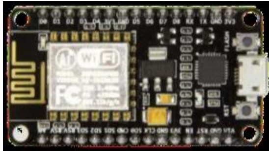
Gambar 2.1 NodeMCU ESP 32