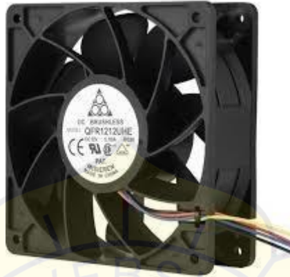
Gambar 2.8 Fan 12V

centrifugal (angin mengalir mengikuti arah poros kipas) dan kipas axial (angin mengalir sejajar dengan poros kipas) (Aulia et al., 2021).