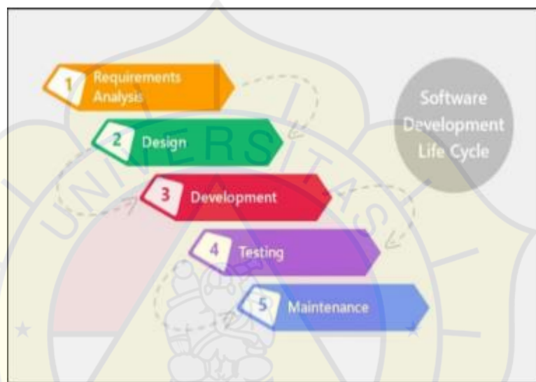
Gambar 1.1 Metode Waterfall (Putri and Taufik, 2024)

Model ini menekankan pada langkah-langkah yang dilakukan secara berurutan dan terstruktur, mirip dengan aliran air terjun, di mana setiap tahapan proses dilakukan secara berturut-turut dari atas ke bawah, dengan langkah-langkah yang jelas dan terdefinisi dengan baik.